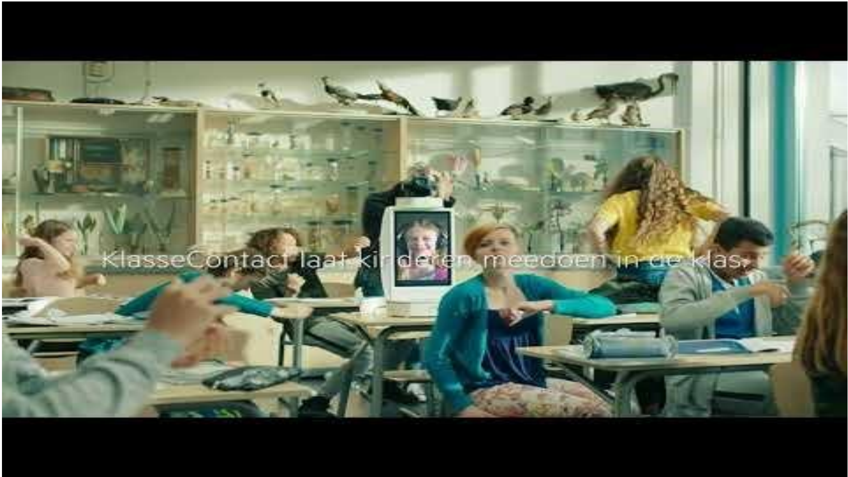
KlasseContact laat kinderen meedoen in de klas.